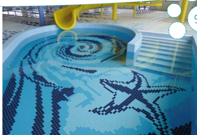
◆ BASEN REKREACYJNY W NOWYM SĄCZU