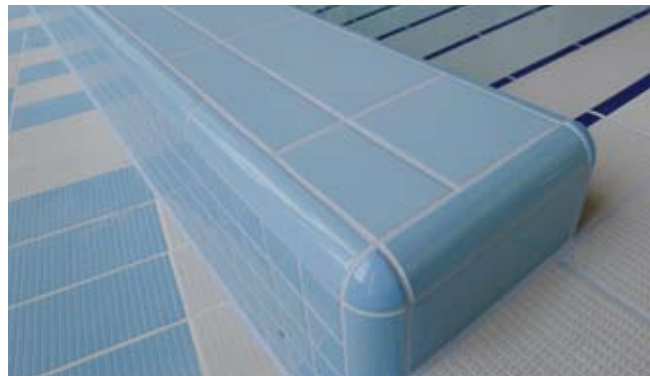
◆ W NASZEJ OFERCIE ZNAJDUJĄ SIĘ WSZYSTKIE KształTKI ORAZ ELEMENTY WYKOŃCZENIOWE DOSTOSOWANE DO WSZELKICH ROZWIĄZAŃ KONSTRUKCYJNYCH