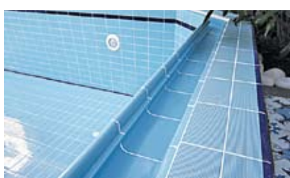
◆ KształTKA WIESBADEN GÓRNY