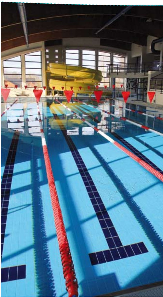
◆ BASEN PŁYWACKI W NOWYM SĄCZU