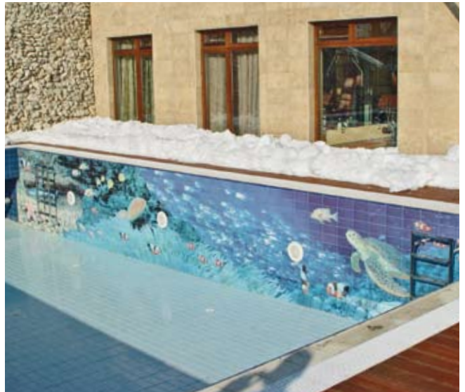
◆ TECHNOLOGIA FOTOSERA