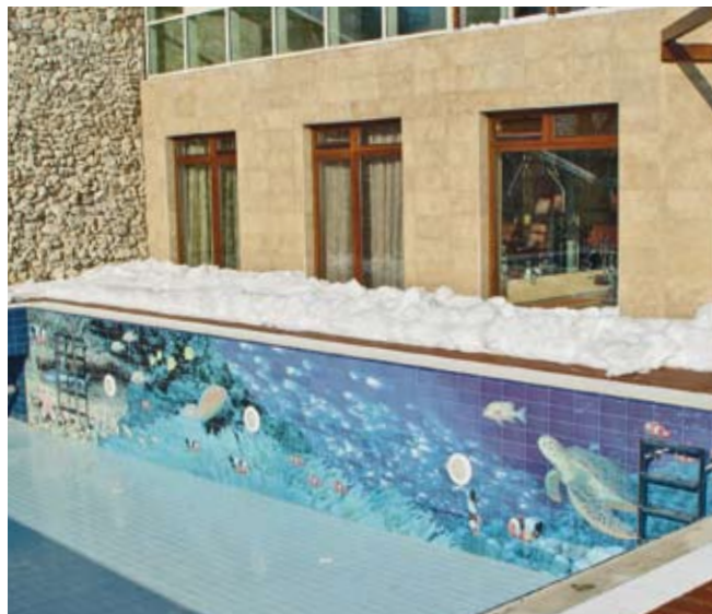
▲ TECHNOLOGIA FOTOSERA